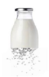
Smart & Sustainable Food Packaging