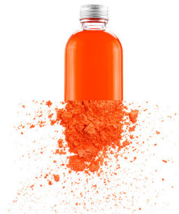
Novel Ingredients & Production