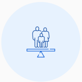
התארגנות בשגרה חדשה <

לעדכון המיקום ושליחת בקשות פרטניות לסיוע <